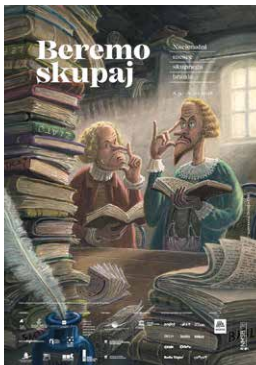
Plakat akcije Beremo skupaj, ilustracija: Zvonko Čoh, ambasador NMSB 2018