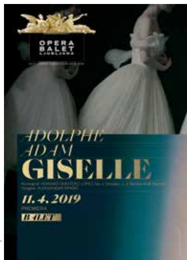
Avtor plakata: Ivan Iljič

Vojvoda Albrecht je zaljubljen v mlado Giselle, preprosto kmečko dekle. Na srečanje z njo prihaja preoblečen v kmeta, svoja razkošna oblačila pa pušča v lovski hišici. Dekle ne ve, da je zaljubljena v plemiča, ki je že zaročen. Njen oboževalec – lovski čuvaj Hilarion – odkrije Albrechtovo skrivnost in poskuša dopovedati Giselle, kdo je v resnici človek, ki ga je izbrala. Dekle ga noče poslušati ... Hilarion se prikraje v lovsko hišico in ukrade Albrechtov meč z viteškim grbom. Rogovi napovedujejo bližajočo se povorko. Courlandski vojvoda se s hčerko Bathildo, Albrechtovo zaročenko, v spremstvu vrača z lova. Bathilda spozna Giselle in ji podari svojo ogrlico. Vojvoda in Bathilde počivata, kmetje proslavljajo, Albrecht in Giselle